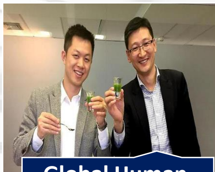
Global Human Capital